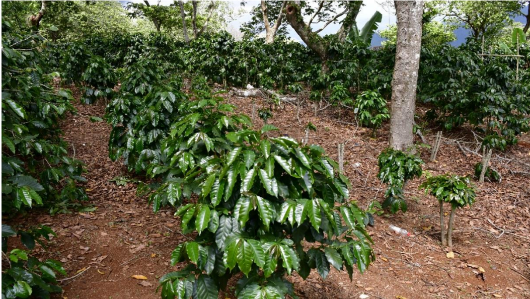
Foto 1. Renovación de cafetales.

Los detalles específicos se encuentran en los cuadros VII y VIII.