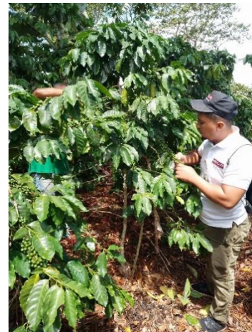
Foto 2: Monitoreo de Broca

Por su parte, el control de malezas abarcó 353,882 tareas distribuidas en 7,121 fincas, pertenecientes a 6,177 hombres y 944 mujeres. Esta práctica es fundamental dentro del Manejo Integrado de la Broca, ya que facilita las labores de repela y pepena (recolección de granos remanentes en las plantas y los caídos al suelo). Además, contribuye a una mejor exposición solar de los frutos no cosechados, promoviendo su secado y dificultando la supervivencia de esta plaga en los cafetales.