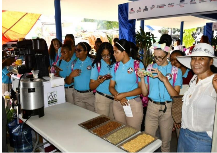
Foto3: Feria nacional: demostración de catación